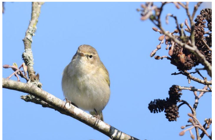
6 Zilp Zalp