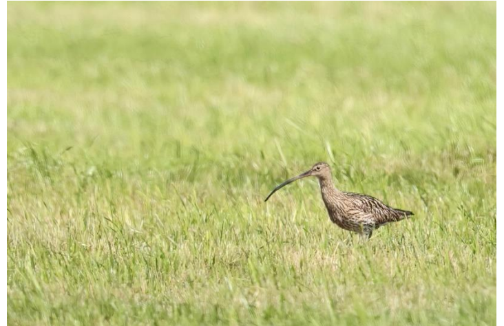
38 Großer Brachvogel