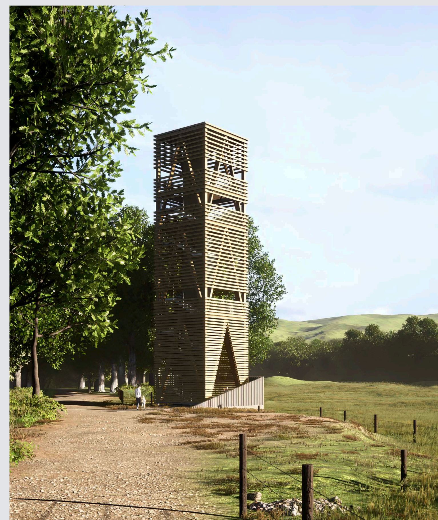
Visualisierung Aussichtsturm, Quelle:Architekturbüro Flick